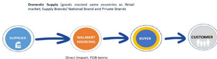
Hình 3. Chuỗi giá trị toàn cầu của Walmart

Các nhà cung cấp của Walmart phải tuân thủ nhiều tiêu chuẩn, bao gồm tuân thủ luật lao động địa phương, luật an toàn lao động địa phương và các luật hiện hành khác.