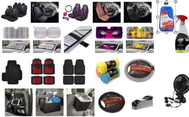
Hình 6. Nhóm các sản phẩm phục vụ làm đẹp ô tô

Nhóm các sản phẩm phục vụ ngành công nghiệp nội thất xe hơi.